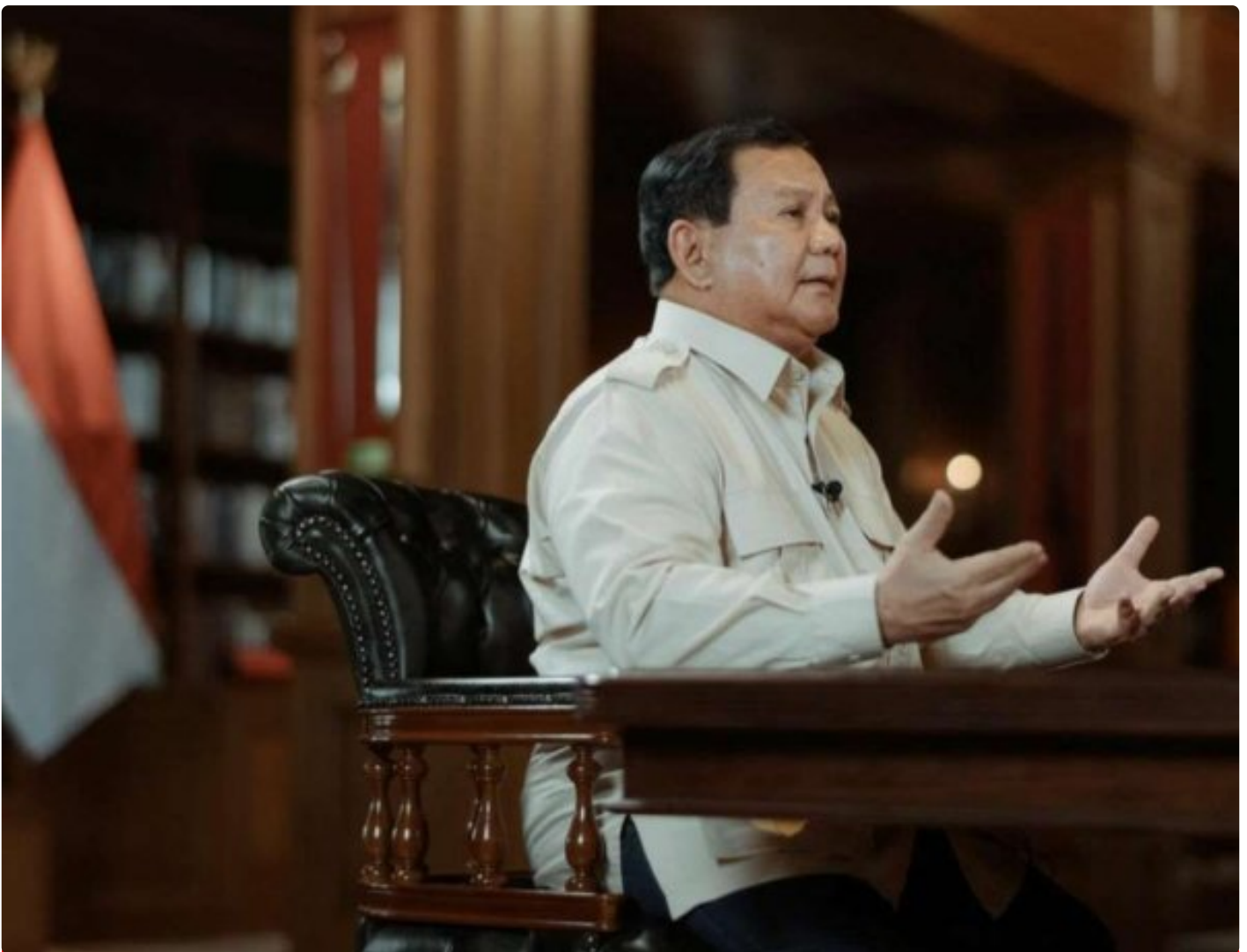
Prabowo Subianto Presiden RI 2024-2029

PENDIDIKAN - Indonesia dikenal sebagai negara yang kaya akan sumber daya alam. Dari hasil tambang yang berlimpah, laut yang luas dengan kekayaan hayati yang melimpah, hutan yang menjadi paru-paru dunia, hingga sumber daya energi yang tersebar di berbagai wilayah, semuanya menjadi kekuatan besar bagi bangsa ini. Potensi besar tersebut seharusnya dapat dimanfaatkan untuk membangun masa depan yang lebih cerah, termasuk mewujudkan pendidikan gratis